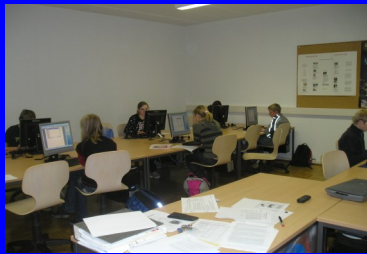
Innovative und klassische Unterrichtsmethoden

Am 08. Juni 2012 erhalten Sie Bescheid, ob Ihr Kind an der Mittelschule Flöha-Plaue aufgenommen werden kann.